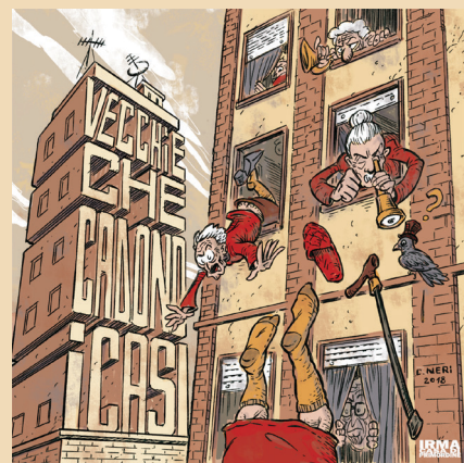
Ascolta VECCHIE CHE CADONO

A marzo 2019 viene pubblicato il secondo disco, sempre sotto etichetta Irma records, intitolato ancora una volta come un racconto di Charms Vecchie che cadono . Il lavoro continua e concretizza ulteriormente le intenzioni presentate nel primo album della band, dando vita a un sound che diventa, con il radicarsi del gruppo, sempre più unitario e compatto.